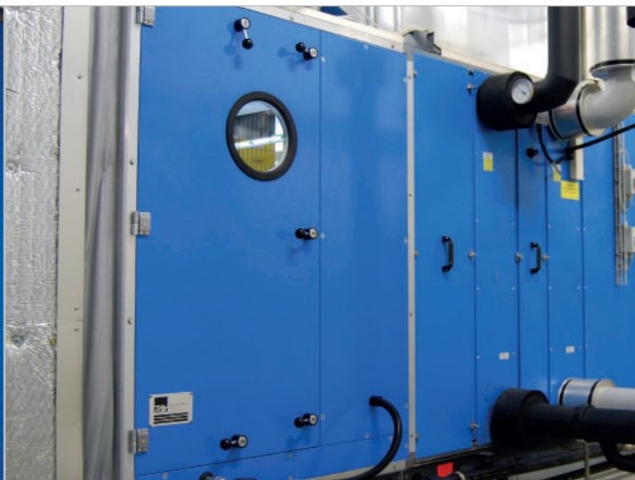
Façade de révision 7Air montée sur la partie humidificateur